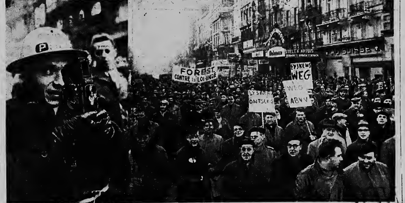
BRUSSEL REBELIOSO. — Esaki ta dos bista durante e ultimo demonstracionnan na Brussel. Izquierda: E fotografo di prensa aqui a saca e sigur pa in segur i a facilita su mes un helm di staa, pasobra fotografanan mucho bez ta infiltra den tur rebelian i varios bez nan sa ricibi golpe. Derecho: Un multitud di miles welgistanan di demonstrantenan ta camna riba un dje gran boulevardnan cu destino pa sitio di Rogier.